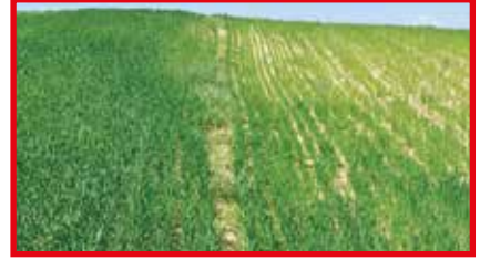
(Belplas Organik Sıvı Gübre kullanılan yerle kullanılmayan yer farkı)

ması gereken gübre miktarı konusunda sıvı gübreleri çok daha avantajlı bir konuma getirmektedir. Ek olarak, katı azotlu gübre kullanımı sonucu kaybolan azot, havaya N 2 O (Nitröz oksit) gazı olarak karışarak küresel ısınmaya en çok neden olan gazların başında gelmektedir. Küresel ısınmanın sebep olduğu iklim değişiklikleri nedeniyle de birçok bölgede yağışlar olmadığı için kuraklık yaşanmakta, ya da ani ve aşırı yağışlardan sel felaketleri olmakta bu da tarımsal faaliyetlere zarar vermektedir.